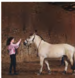
...und muss ihn dann auf Distanz halten.