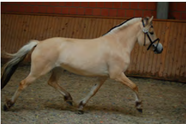
Glød-Tochter Lea im leichteren, noch jugendlichen Erscheinungsbild