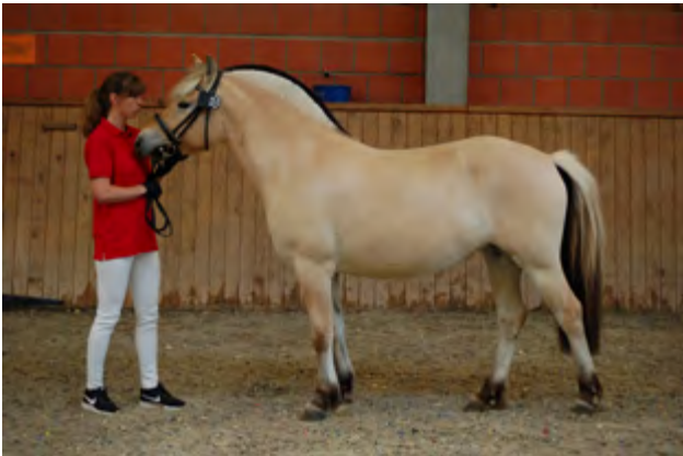
Kjartan-Tochter Haida gehörte in Erbach zu den klaren Prämienanwärterinnen