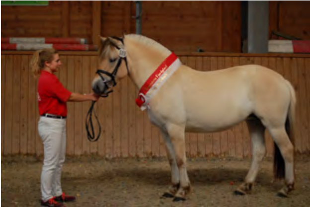
Siegerstute Lotta ist Tochter des Bundesprämihengstes Damar und der Bundesprämiestute Lärke