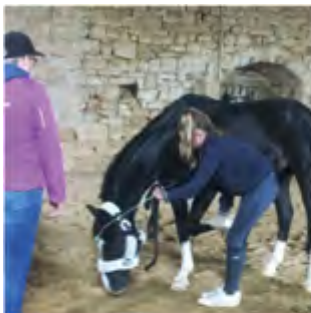
Nike und Dancer