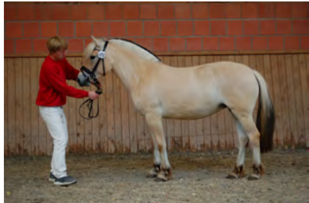
Prämienanwärterin Mie zeigte schon als Fohlen vielversprechende Qualität, die sich jetzt bestätigte